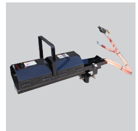
Canal giratorio con calefacción opcional