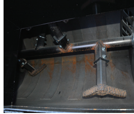
Paletas de agitación inclinadas y en ángulo para una mezcla completa del material y para sostener la suspensión de agregados