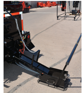
Caja de arrastre

Las patcher están equipadas con un cierre automático en la tapa, lo que proporciona tanto la eficiencia del fusor como la seguridad de los operarios. El Patcher II está equipado con una escotilla vertical, que permite que la olla de colada cubra completamente la abertura, atrapando el calor dentro de la máquina, lo que permite que la masilla restante drene hacia el fundidor.