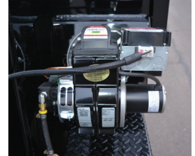
Quemador de bajo consumo de combustible y de fácil acceso