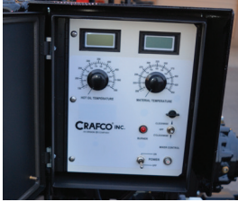
Controles digitales para exactitud de la temperatura